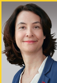
Estelle Brachlianoff, Generálna riaditeľka Veolia

V šade tam, kde skupina Veolia pôsobí, sa usiluje propagovať svoje vlastné hodnoty, ktoré vychádzajú zo samej podstaty jej existencie a ktoré oficiálne schválila 18. apríla 2019. Skupina Veolia taktiež prísne dbá na dodržiavanie zákonov v každej krajine a pravidiel správania ustanovených medzinárodnými organizáciami.